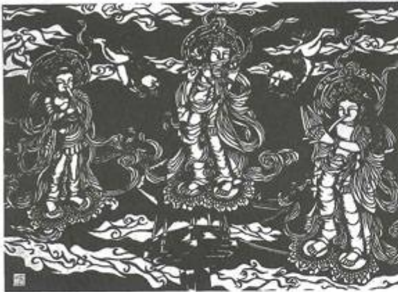
優秀賞 天平の演奏