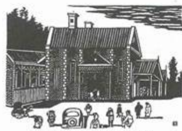
切り絵：後藤伸行「石川啄木の世界」より