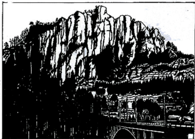
岩櫃城の岩 黒岩功一