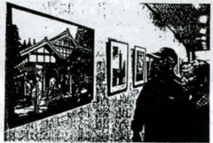
会場に並ぶ切り絵の力作 県高岡文化ホールで

県切り絵同好会の県西部の会員でつくる呉西地区クラブの作品の展示が二十二日、高岡市の県高岡文化ホ