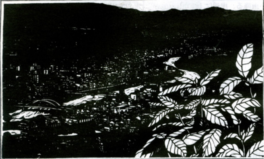
切り絵 江田 雅子 (岡山県津山市)