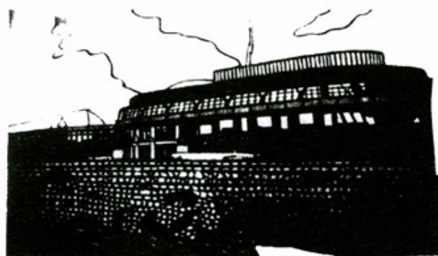
わくわくどーむ 切り絵 江森 英男