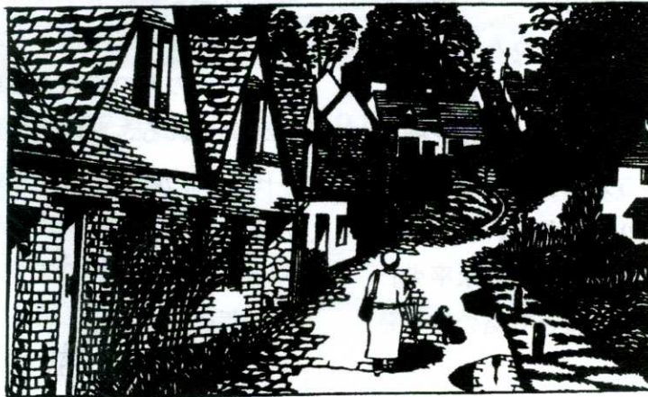
英国コッツウォルズの街並み 松本正一 群馬県 高崎市

高崎市 高崎市 藤岡市 小川町 前橋市 北本市 沼田市 函館市 上尾市 上尾市 前橋市 伊勢崎市 川場村 朝霞市