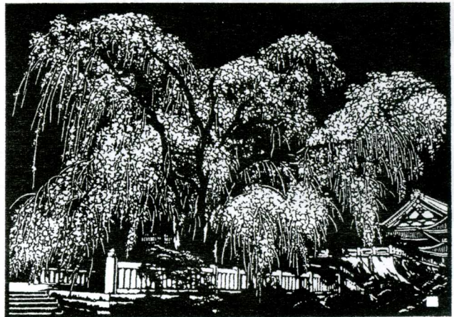
桜花 久遠寺 (70×85)