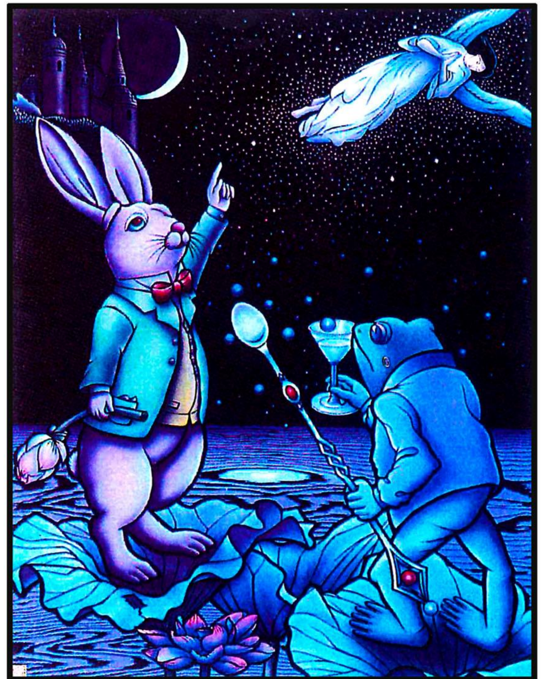
星のしずく集めて 2016年10月作