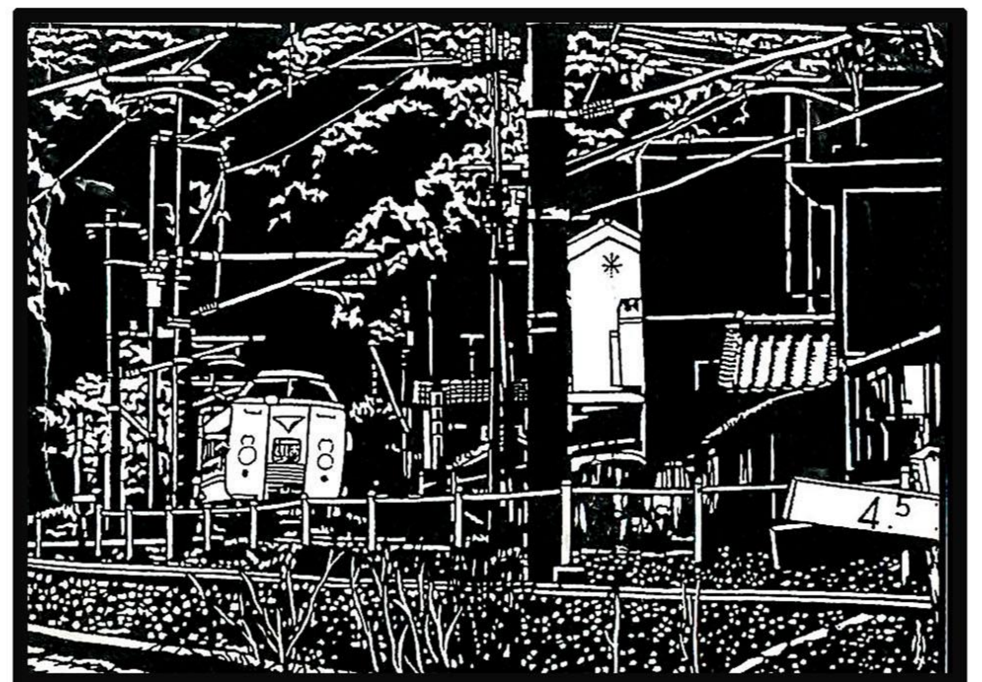
伝統と文化の町を走る特急 2017年7月作 (和歌山県海南市)

「全国切り絵同好会の会員になって二十数年、いろいろな思い出が蘇ります。風景を見たり、街の雑踏の中で歩いていたり人々の姿をどうすれば切り絵に表現できるのか？などと最初の頃は思っていました。切り絵は絵画芸術であり、特に光と影が重要な要素であると思います。誇張と省略を考えながら構図を磨き上げてゆくことも大切なことでありましょう。」